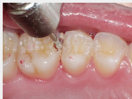
図3: ラウンドタイプのMIステンレスバーにて感染象牙質を除去。