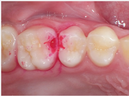
図4:う蝕検知液(カリエスチェック:ニシカ)による染色。