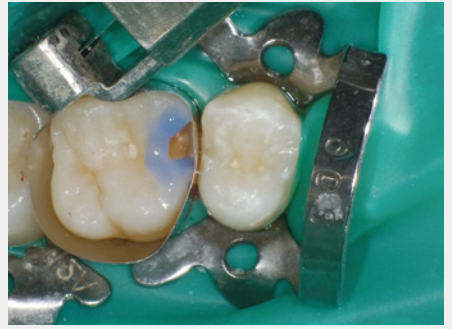
図12: 窩縁部エナメル質へのセレクトイブエッチング。