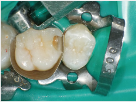
図16: 歯肉側窩縁部に限局したフロアブルレジン塗布・光照射。