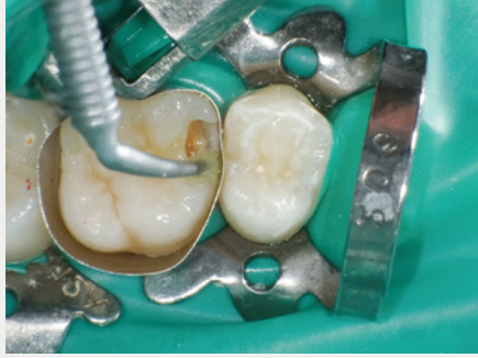
図14: クリアファイル® メガボンド®2(クラレノリタケテンタル)ボンディングの塗布。