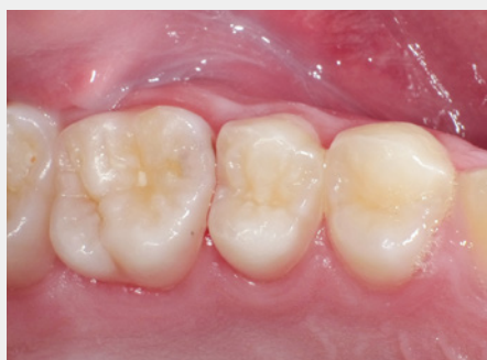
図1: ①(ミラー像)近心隣接面に初期う蝕を確認。