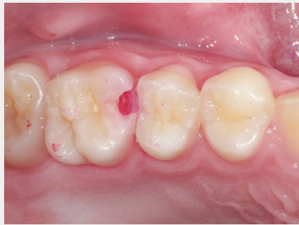
図5:水洗・乾燥後、染色部分を削除。