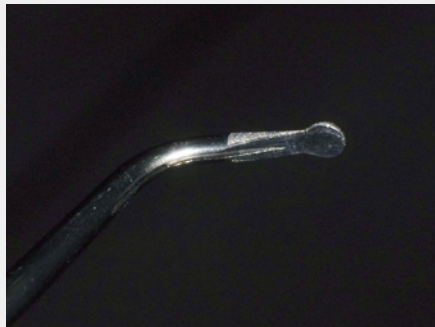
図8:エアースケーラー専用のダイヤモンドチップ。半球状の形態で片面のみ切削可能。「S67D」