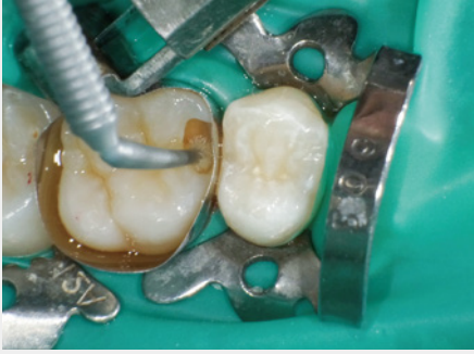
図13: クリアファイル® メガボンド®2(クラレノリタケテンタル)セルフエッチングプライマーの塗布。