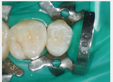
図21: 充填操作の完了後、隔壁装置を撤去して追加の光照射。