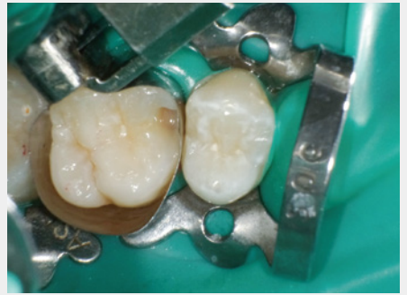
図18: 窩洞底部への第2層目のフロアブルレジン充填・光照射。