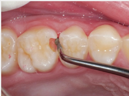
図7:遠心隣接面部への誤切削に注意して、歯肉側窩縁部のエナメル質を滑らかに仕上げ。「S67D」