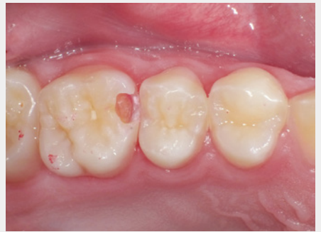
図6:感染象牙質の除去後、歯肉側窩縁のエナメル質白濁部分を確認し除去する方針。