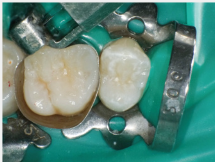
図20: 最終層としてペーストタイプレジン充填して辺縁隆線部の形態を付与。