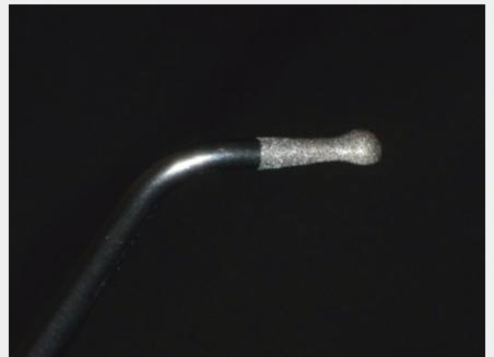
図9:アングルの外側に半球状の切削部位が設定されている。「S67D」