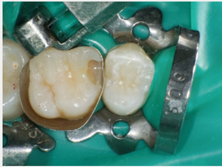
図17: 重合収縮応力に配慮して、窩洞底部への第1層目のフロアブルレジン塗布・光照射。