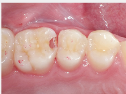
図2: う窩の開拡を行い、う蝕の全体像を把握。