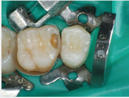
図11: ラバーダム防湿後、トツフルマイヤータイプのマトリックスシステムを設置。