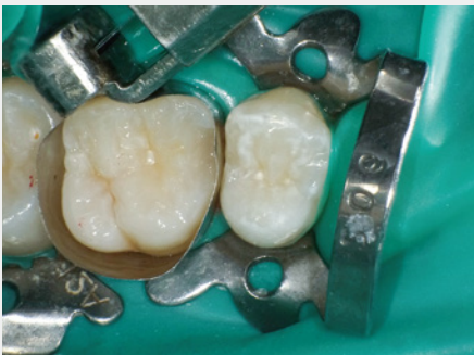
図19: 窩洞底部への第3層目のフロアブルレジン充填・光照射。