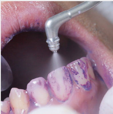
図5: ステインの状態に応じて、パウダー量(パワー)と水量をそれぞれ10段階で調整でき、小さく扱いやすいヘッドで操作が容易です。

インは歯肉縁上用チャンバー(プロフィーシステム)で、通常のステインや歯周ポケットには歯肉縁下用チャンバー(ペリオシステム)と瞬時に交換が可能。また、パウダーの噴射力と水の量がそれぞれ10段階あり、ステインの状態や自分好みに細かく設定(パウダー6~9、水10)できます。臨床での私の使用頻度は、ほぼペリオメイトパウダー(グリシン25 \mu m)を使用しており、理由としては、アミノ酸であるグリシンはエピテンスが豊富でステインの除去、および3mmまでの歯周ポケットにも届くオールラウンダーなパウダー 1) だからです。臨床的には、使用後の歯面の舌感(ツルツル)、口腔内での使用感(チクチクせず軟組織への影響も少ない) 2) 、象牙質を傷付けず低侵襲性で歯面に優しい 3) (根面露出部や補綴装置へも気にせず使える)、水溶性(インプラント部や歯周ポケット内への残留も無いので安心)、ほとんどのステインが取れる(ペリオメイトノズルチップ無し)、歯肉縁下専用チップ(ペリオメイトノズルチップ)を付ければ深いポケットの中にも使える。以上のことからペリオメイトパウダー(ペリオシステム)を好んで使用しています。