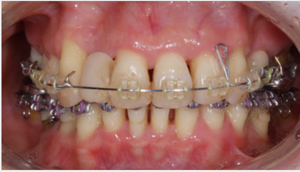
歯周治療終了時(矯正治療中)