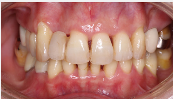
矯正後メンテナンス時(補綴治療中)

歯肉の炎症が無くなった後の矯正期間中は、ブラーク除去を目的にパウダーメンテナンスで、ブラケット周囲などの器具が入りにくい部位へ対応し、歯肉縁上歯石除去は超音波スケーラーに持ち替えて除去(G6チップを使用)。また、ポケットの深い部位に出血(炎症)がある場合は、P40チップ(図3)を使いポケット内をイリゲーションしました。