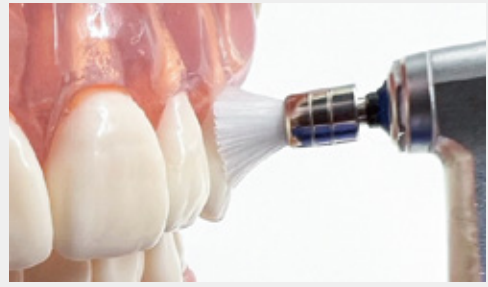
図2-b: 柔らかい毛質のブラシ(図1-b)では、軽い圧力で毛先が歯頸部へ届くため歯面への負担も少なくなります。