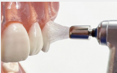
図2-a: 硬い毛質のブラシ(図1-a)では、ある程度の圧力をかけないと毛先が歯頸部へ届きません。圧力と硬さで歯面への負担も大きくなります。