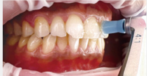
図3: ラバーカップには様々な表面形状がありますが、歯頸部や歯面、下部鼓形空隙にフィットしやすく歯面に負担の少ない柔らかい材質を選択して使用しています。

ブラシは、パウダーメンテナンスを施すほどでもない少量のステイン除去時に使用します。その場合のペーストはラバーカップの使用時とは異なり、粗い研磨剤が配合されているペーストを使用します。基本的に硬い毛質のブラシはエナメル質表面への負担が大きいため、筆者が日常臨床で使用することはありません。